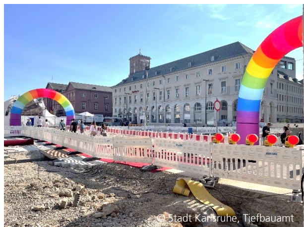
Abbildung 4: Baustelle während des Christopher Street Day