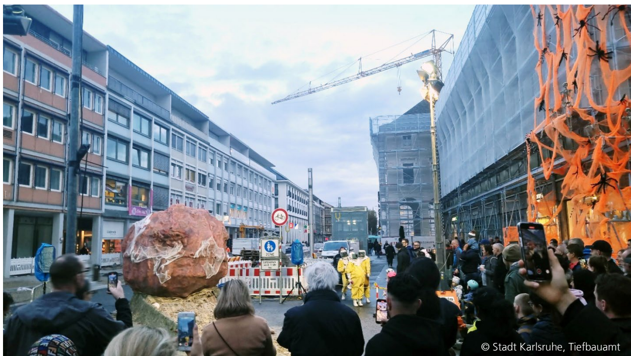
Abbildung 9: Aktion am Baufeld zu Halloween 2023

Ziel dieses Konzeptes ist es die Kommunikation zwischen Anliegern und dem Projektteam zu vereinfachen und durch gezielte Maßnahmen einen positiven Fokus auf die Baustelle und die Karlsruher Innenstadt zu legen.