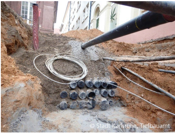
Abbildung 7: Leitungsverlegung Baufeld 3a