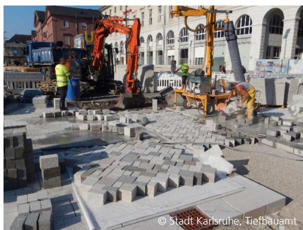
Abbildung 5: Pflasterverlegung im Sommer 2023