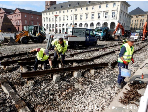
Abbildung 3: Rückbau der Gleise

Insbesondere die Verlegung von Leitungen, in teilweise sehr beengten Räumen, stellte die Bauausführung vor große Herausforderungen. Dennoch können die Baufelder in eine dem Zeitplan entsprechende Winterpause gehen, bevor es im neuen Jahr wieder mit voller Kraft weitergeht.