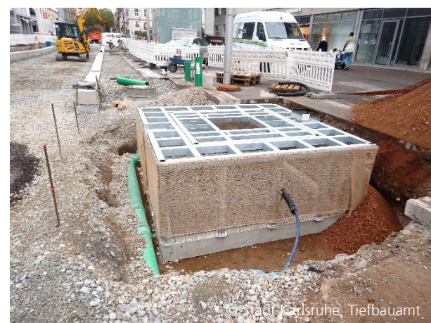
Abbildung 6: Baumquartiere in der Kaiserstraße