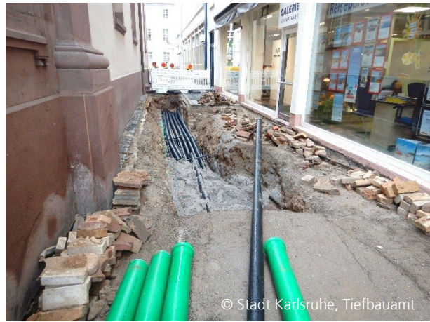
Abbildung 8: Leitungsverlegung Baufeld 3a

Gemeinsam mit der KME, der Karlsruhe Marketing und Event GmbH, hat die Projektleitung des Tiefbauamts ein umfangreiches Konzept zur Kommunikation mit Anliegern und Öffentlichkeit entwickelt.